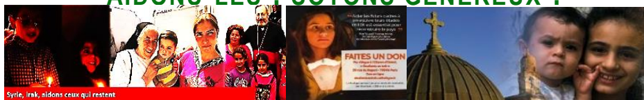
Syrie, Irak, aidons ceux qui restent